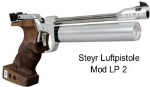
Steyr Luftpistole Mod LP 2

Steyr Sport GmbH, Olympiastrasse 1, A-4432 Ernsthofen, Austria